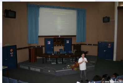
Conférences « An nou kozé di la science »