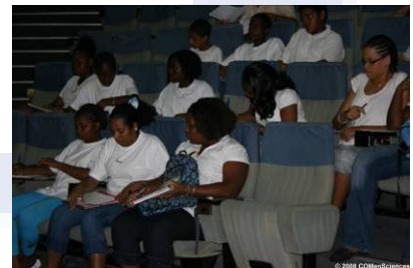
Conférences « An nou kozé di la science »