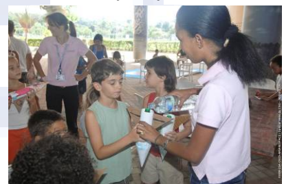
Après-midi au Musée de l'espace