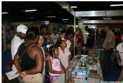
Village des Sciences