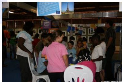
Village des Sciences