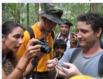
Fête à l'Ecomusée municipal d'Approuague-Kaw