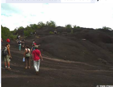
Fête à l'Ecomusée municipal d'Approuague-Kaw