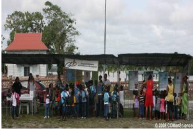
Mini-village de SLM