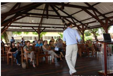
Portes Ouvertes Institut Pasteur de la Guyane