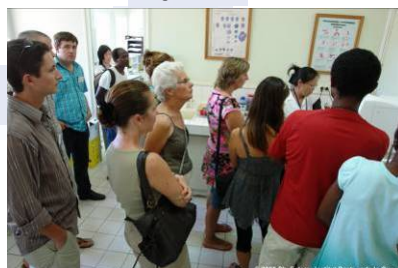
Portes Ouvertes Institut Pasteur de la Guyane