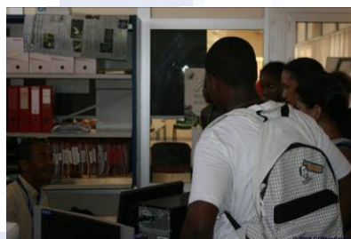
Rallye des lycéens