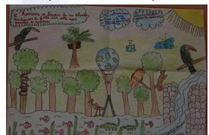
Village des Sciences