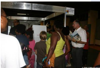
Village des Sciences