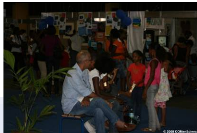
Village des Sciences