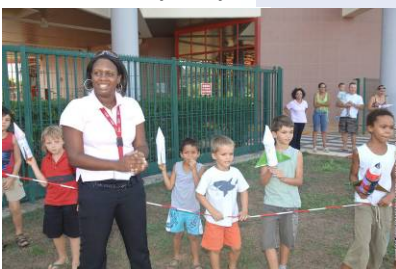
Après-midi au Musée de l'espace