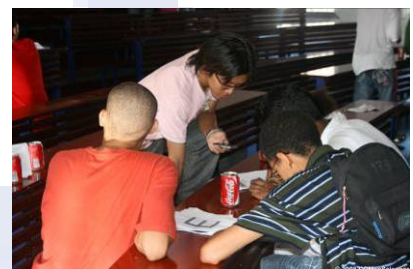
Rallye des lycéens