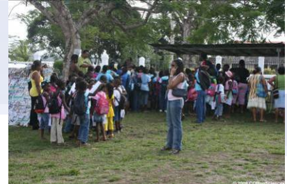
Mini-village de SLM