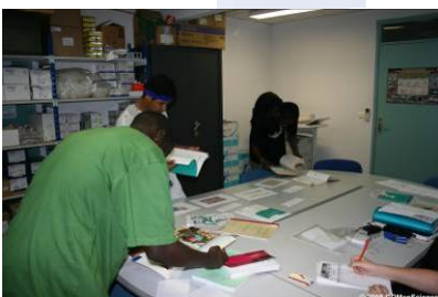
Rallye des lycéens