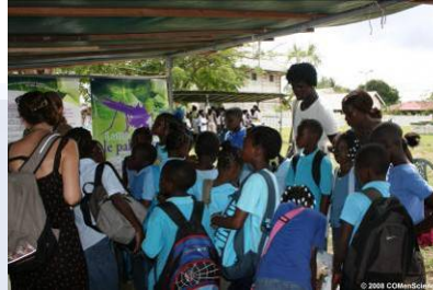
Mini-village de SLM