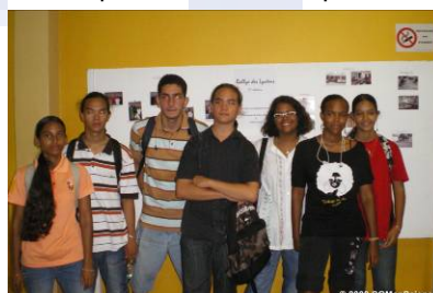
Village des Sciences