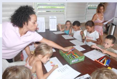
Après-midi au Musée de l'espace