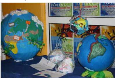
Village des Sciences