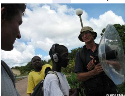
Fête à l'Ecomusée municipal d'Approuague-Kaw