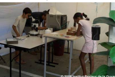
Portes Ouvertes Institut Pasteur de la Guyane