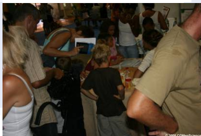
Village des Sciences