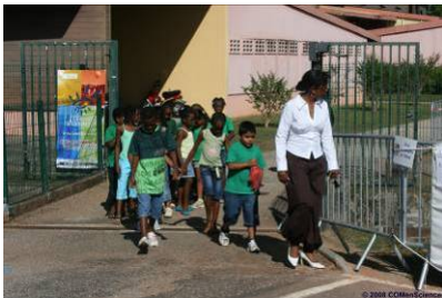
Village des Sciences