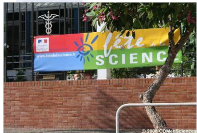
Conférences « An nou kozé di la science »